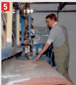
5 In der Waschstraße werden die Teppiche gewaschen.