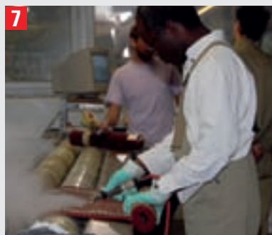
7 Als letztes gehen die Teppiche durch die Endabnahme. Hier werden einzelne Flecken nachdetachiert oder entschieden, ob die Teppiche nochmals in die Wäsche kommen.