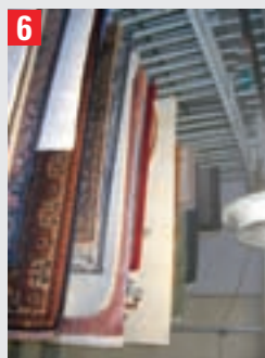
6 Anschließend werden alle Teppiche klargespült, gequetscht, geschleudert und zum trocknen aufgehängt.