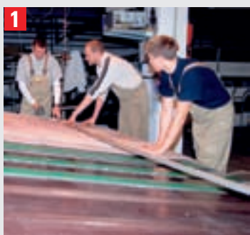
1 Eingangskontrolle: Die Teppiche werden über einen Messtisch gezogen und dabei vermessen. Die Daten werden um die Teppicharten und eventuelle Mängel ergänzt. Hier wird im Einzelfall über den späteren Waschverlauf unterschieden.