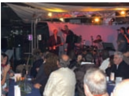
Für die musikalische Untermauerung sorgte bei der Jubiläumsfeier die Band „Railroad Crossing“ mit Hits aus den 60er und 70er Jahren.

Rund 140.000 Quadratmeter Teppich bearbeiten die Teppichreinigungsspezialisten jedes ▶