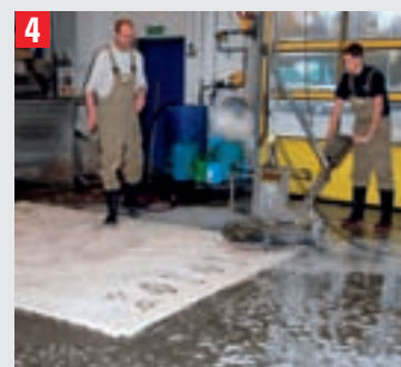
4 Stark verschmutzte oder empfindliche Teppiche werden auf dem Boden liegend mit einer „Dreischeibenmaschine“ gewaschen. Kontrarotierende Bürsten massieren das Waschmittel dabei richtig in den Flor ein.