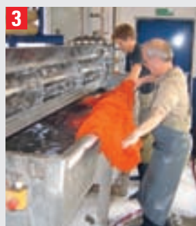
3 Berberteppiche werden in sogenannten „Paddelkufen“ 1/2 Stunde lang gewaschen. Das sind große Becken, in denen das Wasser permanent in Bewegung gehalten wird. Dabei löst sich auch tief sitzender Schmutz.