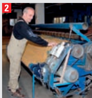
2 Als nächstes werden die Teppiche maschinell geklopft. Die Teppiche laufen dabei verkehrt herum über eine rotierende Walze. Der Staub wird direkt abgesaugt.